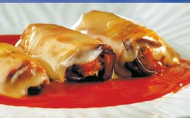
Aubergine rolls Rollitos de Berenjenas