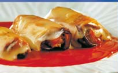
Aubergine rolls Rollitos de Berenjenas