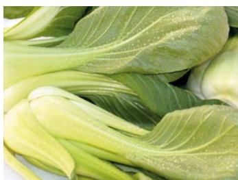
► Pac Choi

La col picuda o corazón de buey botánicamente Brassica oleracea var. capitata , se caracteriza por presentar una cabeza compacta terminada en punta, de