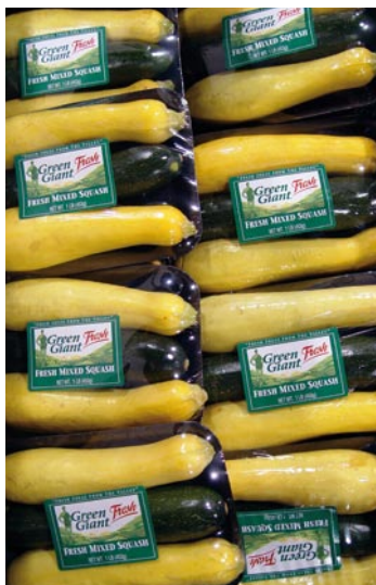
► Unidad de venta con calabacín amarillo y verde

El calabacín, zucchini, zapallito o zapallo italiano es una de las dos variedades de (Cucurbita pepo). En la actualidad es también cultivada extensamente en toda Europa como calabazas de verano.