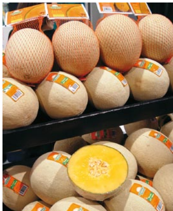
► Tipos Cantalupo de carne amarilla

y tonos intermedios. En el centro hay cavidad que contiene muchas semillas recubiertas de una sustancia pegajosa.