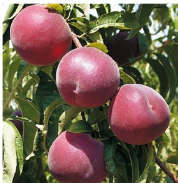
► Sweet Love ®