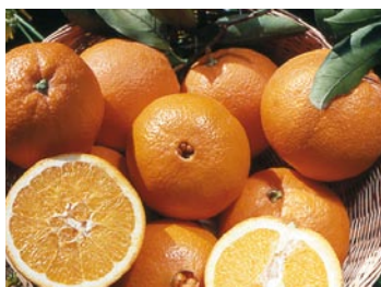
► Washington Navel