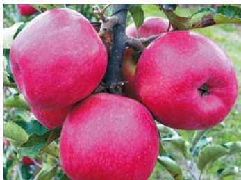
► Pink Lady®