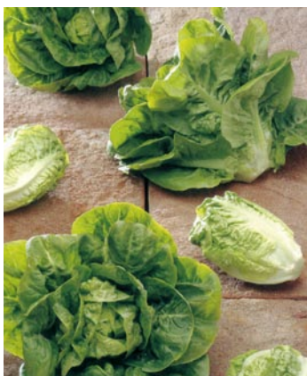
► Los llamados Cogollos de Tudela, las Little Gem son lechugas tipo Romana "minis"