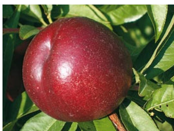
► Garaco ®