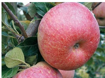
► Fuji Kiku®8

Variedad de recolección tardía de alta calidad gustativa, sabor dulce y textura jugosa y crujiente. En la foto variedad de color estriado Kiku®8.