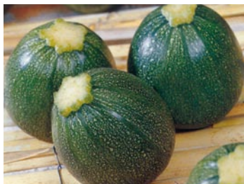
► Tipos redondos