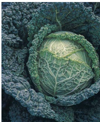
► Tipo de Milán o Savoy