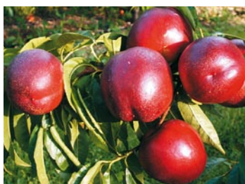
► Big Top ®