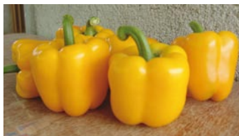
► Cuadrados o tipo california