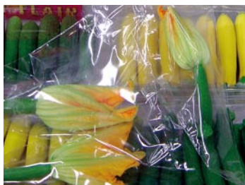
► Flores de calabacín. Una delicia gastronómica