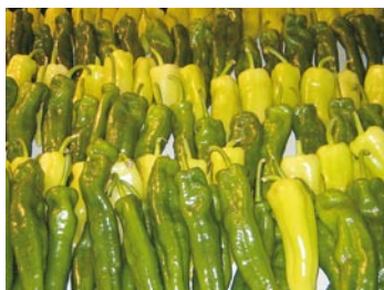
► Tipo "dulce italiano"

Hay pimientos que son picantes, están los del tipo Padrón -el nombre le viene por el pueblo gallego del mismo nombre- los Najeranos y el tipo mallorquín, los Anaheim, el verde grande "Búlgaro", los tipos medio largo de Asia, los Jwala, el Keriting, el tipo húngaro amarillo brillante y el guajillo.