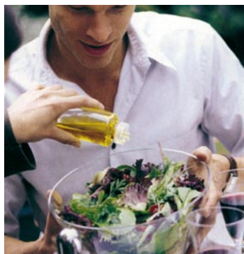
► En ensaladas la creatividad es accesible a todos