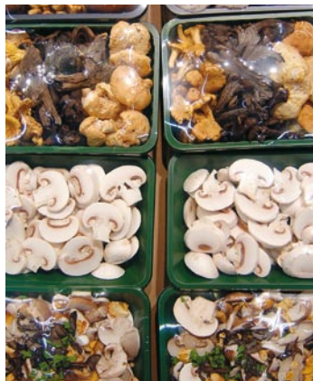
► Típicas presentaciones de setas listas para usar

Las setas no se cultivan en huertos, sin embargo desde un punto de vista de comercio alimentario las setas comestibles pueden incluirse en el grupo de las hortalizas. Son ejemplos de setas comestibles el champiñón, el gurumelo, el níscolo, el gallipierno o la oronja (en Catalán Ou de Reig).