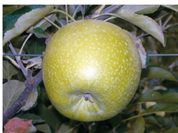
► Granny Smith