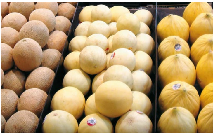
► A la izquierda melón Cantalupo americano de carne anaranjada, a la derecha el Honey Dew y en el centro el tipo Crenshaw