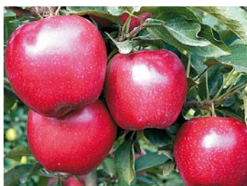
► Red Chief®