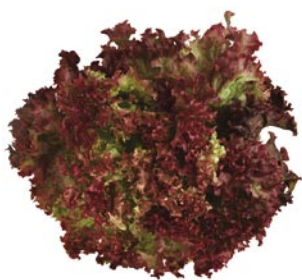
► Hoja de roble, Lollo Rosa