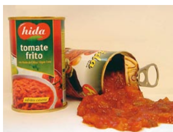
► El tomate listo para usar en la cocina es una oferta plural de la industria alimentaria