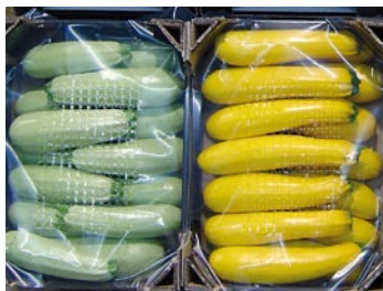
► De verdes hay oscuros y otros más claros, en la foto junto a un tipo amarillo