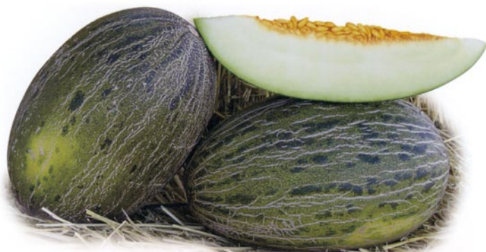
► Tipo piel de sapo