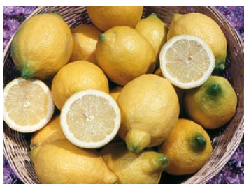
► Limón Verna