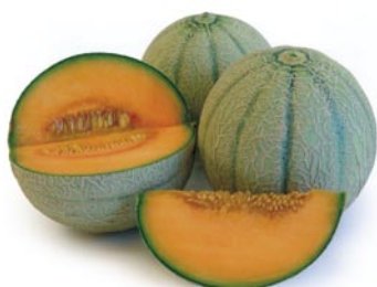
► De tipos "cantalupo" los hay con distintos aspectos y retículas en la corteza, y de carne más o menos anaranjada