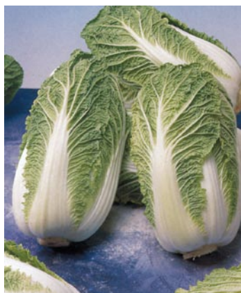
► Col china