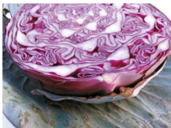
► Roja o tipo lombarda