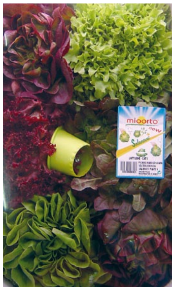
► Una "salad box". Son cajas con un mix de unidades en tipos de lechugas enteras