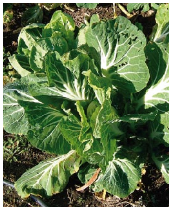
► Col de hoja