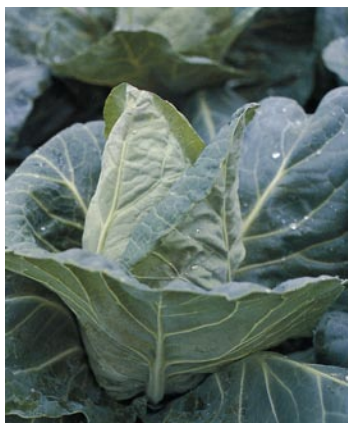
► Alargadas o picudas