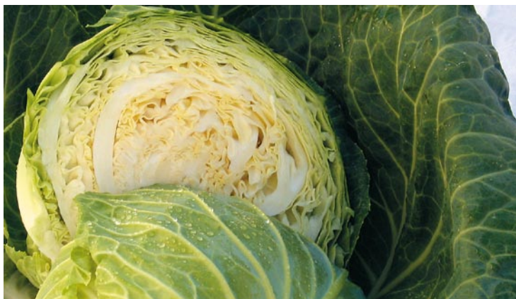
► Col blanca

desde la antigüedad para la preparación de sopas y como alimento de los animales de granja con el objeto de mejorar la calidad de su carne. Las Brassicas son en esencia hortalizas de invierno, pero gracias a la existencia de numerosos cultivares y a las diversas procedencias, pueden encontrarse disponibles durante todo el año.