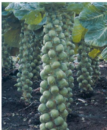
► Col de Bruselas